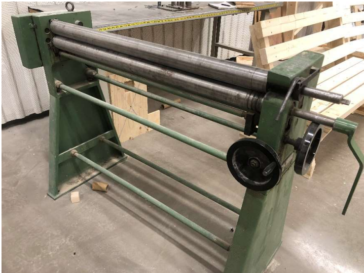
8. Plåtvalsmaskin, arbetsbredd 1020 mm