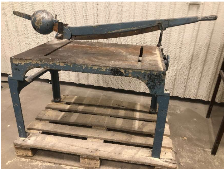
9. Slagsax tyngre modell med stativ/bord, skär saknas på rörliga delen