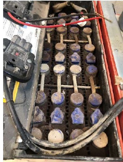
5. Ledtruck Varta 2500 RVT, batteriet 24 V defekt och behöver bytas