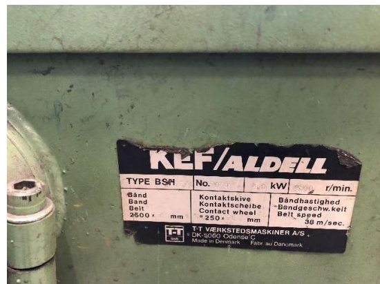
3. Bandslipmaskin KEF/Aldell BSH, slipbandet 75x2500 mm