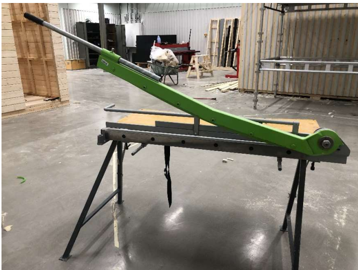
10. Slagsax med stativ/bord, 1000 mm