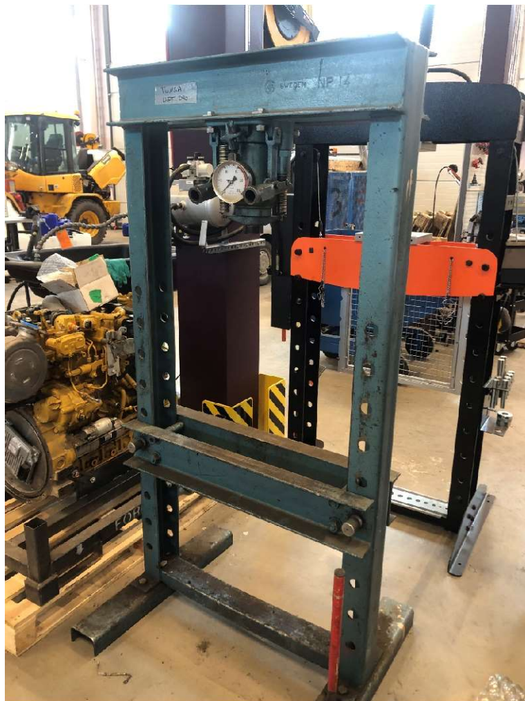
11. Verkstadspress, höjd ca 120 cm, mätaren visar 0-25 ton