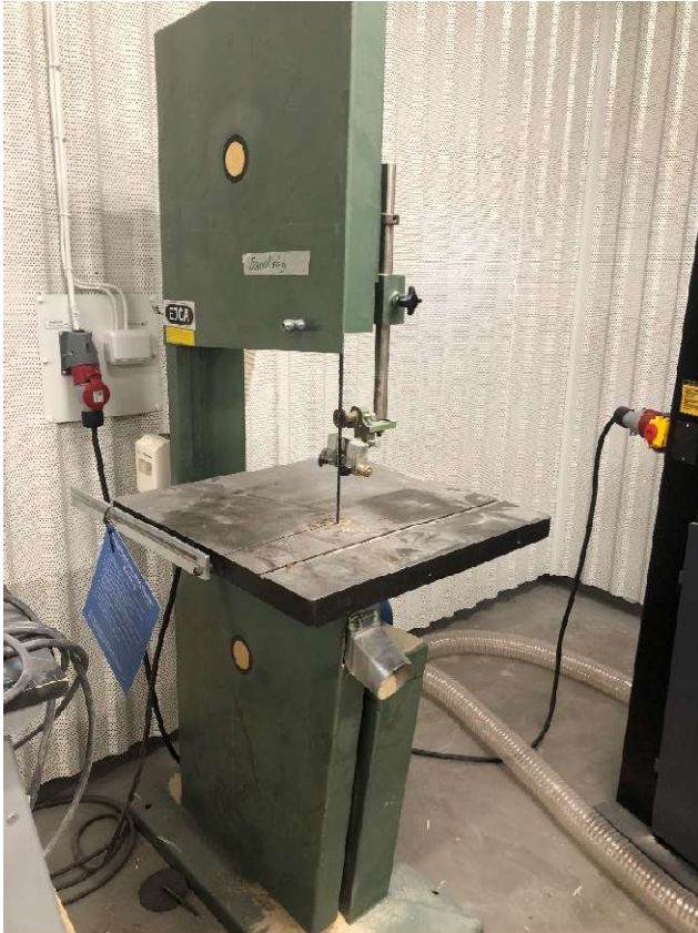
6. Bandsåg EJCA, ca 180 cm hög, 380 V