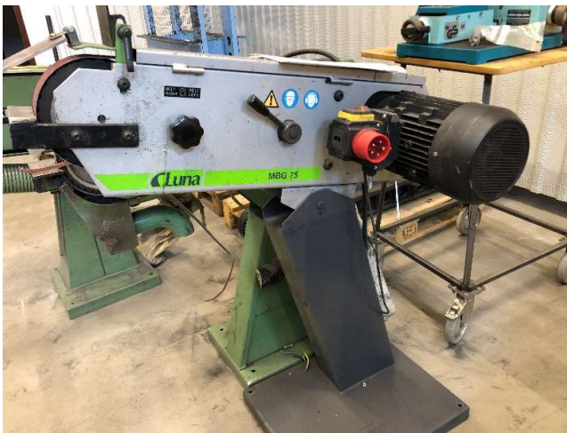
2. Bandslipmaskin Luna MBG 75, slipbandet 75x2000 mm