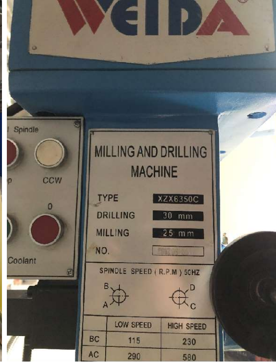
4. WEIDA Milling and drilling machine XZX6350C, oanvänd, på lastpall