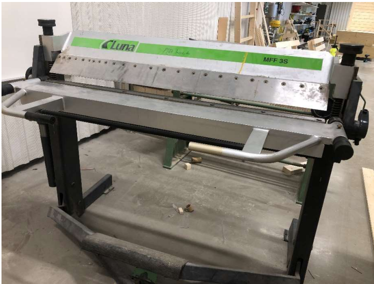
7. Kantmaskin Luna MFF 3S, fotmanövrerad, 1270 mm arbetsbredd