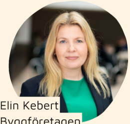
Elin Kebert Byggföretagen